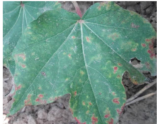
हरा तेला एवं मरोडिया